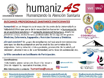
Figura 1. Cartel de captación de profesionales sanitarios, curso 2023-2024.