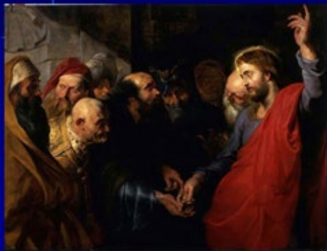
"El dinero de los tributos" Rubens