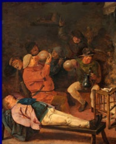
"Campesino borracho" Adriaen Brouwer

Para componer el cuadro, puede que Rembrandt copiase varias ideas de otros pintores, por ejemplo, la composición está tomada de "El dinero de los tributos", de Rubens y la disposición del cadáver es idéntica a la del "Campesino borracho" en una taberna" de Adriaen Brouwer. Los asistentes no están colocados linealmente sino conforme a criterios teatrales como hecho novedoso.