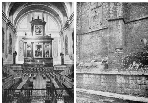
Aspecto interior y exterior de la Capilla- Paraninfo

construyó en 1492 la Capilla, que fue sufragada por el Almirante de Castilla, Don Alonso Enríquez, consagrándose después de la finalización de la construcción de la iglesia como de San Juan Bautista, el 17 de marzo de 1517 y que estuvo con advocación de San Nicolas de Bari sirvió como Paraninfo y fue concluida entre los años 1509 a 1517, al final bajo el patrocinio de la Reina Juana I de Castilla. Su finalidad era que los estudiantes pudieran oír misa sin distraerse mucho del estudio, pero tuvo además el uso de celebraciones en ella de los actos solemnes de la Universidad. El patio era rectangular 5 y 6 arcos medio punto, porticado en la parte inferior y la de superior de capitel. Disponía de 9 Aulas Generales para 4 Facultades.