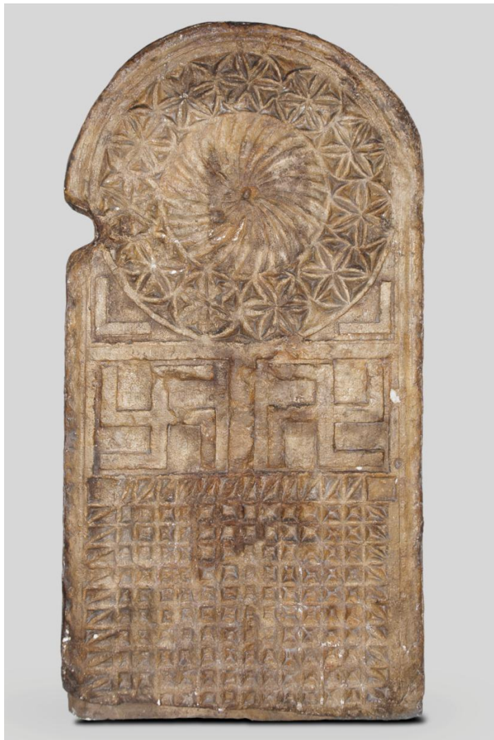
Fig. 3. Der Hakenkreuzsteinkopie . Fotografía reciente (marzo de 2022) de la copia en yeso (Museum für Vor- und Frühgeschichte – Staatliche Museen zu Berlin. Fotografía: C. Klein).

Esta reproducción del monumento arqueológico (fig. 3), permite hacer algunas estimaciones y precisiones adicionales. La decoración del cuerpo superior estaría dominada por un disco central de veinticuatro radios curvos de aproximadamente unos 30,0 cm de diámetro, que podrían corresponderse con el motivo IA que Abásolo codifica para la decoración de las estelas de Lara de los