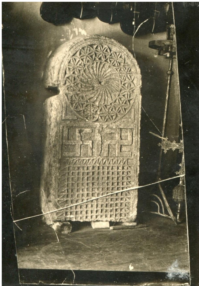
Fig. 2. Der Hakenkreuzstein . Fotografía más antigua del original de la pieza, al parecer todavía en posesión del anticuario Evencio Luis López en ese momento –Burgos, circa 1926–. (Archivo del Museum für Vor- und Frühgeschichte: SMB-PK/MVF, I A 14, Bd. 28, E 1032/26).

La ubicación inicial de esta pieza arqueológica, conocida ya por su decoración como der Hakenkreuzstein , fue al pie de la escalera del Martin-Gropius-Bau, (antes Kunstgewerbemuseum Berlin), donde se exhibiría sin