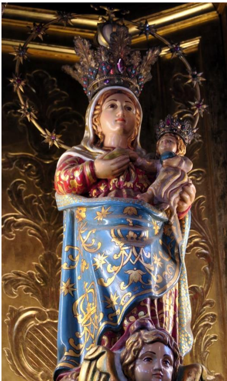
Fig. 1. Corona de la Virgen de la Esclavitud . Julio Lado Martínez. Medios del siglo XX. Padrón (La Coruña). Fotografía de Alberto Rey Castro, técnico de turismo de Padrón

Finalmente, en torno a mediados del siglo XX ubicó como de los Lado un cáliz y un copón para Santa María do Azougue (Betanzos) y la corona de Nosa Señora da Escravitude (Padrón) (fig. 1). 6