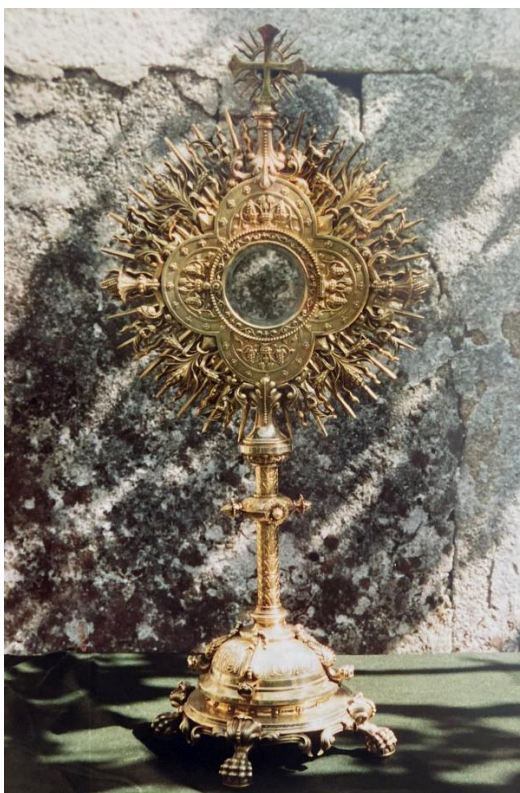
Fig. 5. Custodia . Andrés Lado Puente. 1925. San Lourenzo de Salcidos. A Guarda (Pontevedra).

En 1914 la prensa dio cuenta de la construcción en su obrador de dos nuevas coronas para un Niño Jesús y un san José de Pontevedra, 78 aunque lamentablemente no se especifica la parroquia.