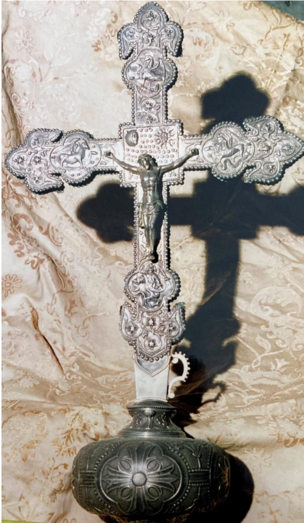
Fig. 7. Cruz parroquial . Andrés Lado Puente. Finales del siglo XIX. San Lorenzo de Seira. Rois (La Coruña).

La primera pertenece a la parroquia de San Lorenzo de Seira (fig. 7) y adopta la forma habitual de las cruces de finales del siglo XV y principios del XVI en Galicia, en especial de un modelo concreto, la extraordinaria cruz de San Fiz de Solovio, conservada actualmente en la Catedral, y que en el contexto revivalista del último tercio del siglo XIX fue copiada en Compostela por más plateros, por ejemplo, Ricardo Martínez. 93 El esquema, común a muchas piezas de la época en toda Europa, se basa en una cruz latina, remates flordelisados, medallones intermedios en los brazos y cuadrón cuadrado sobresaliente. También es común