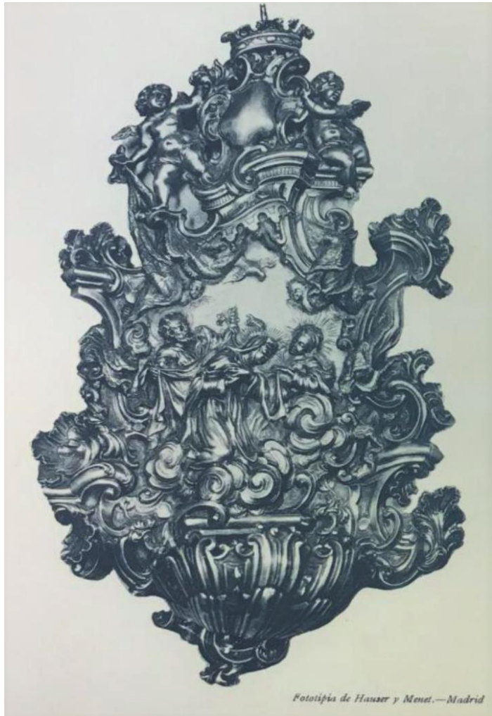
Fig. 6. Pila de agua bendita. Anónimo. Siglo XVIII. Paradero desconocido.