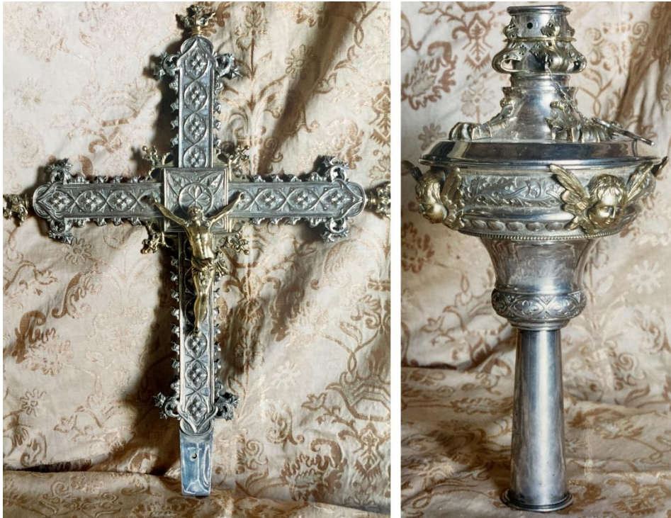
Figs. 8-9. Cruz parroquial y macolla . Andrés Lado Ponte. Finales del siglo XIX. Santa Locaia de Branzá. Arzúa (La Coruña).

que en la mayoría de estas obras el perfil se anime con una sucesión de salientes góticos, aunque en este caso el borde está decorado por un contorno de perlas troqueladas que lo recorre por completo. Los medallones intermedios de los brazos se decoran con los símbolos del Tetramorfos, y el cuadrón con el sol y la luna sobre un fondo punteado que imita a las estrellas. En el reverso, protagonizado por un ecléctico Salvador sedente enseñando las llagas, los medallones se decoran con una gran flor cruciforme con botón central que se repetirá en la macolla. El resto de la superficie se anima en horror vacui con delgados tallos que se retuercen sobre sí mismos para acoger a florecillas. A diferencia de las cruces medievales, donde la macolla a menudo se realizaba en forma de Jerusalén Celeste, en este caso es de manzana aplastada, con un grueso bocel ceñido inferior y superiormente por dos cuellos, con toda la superficie decorada con adornos vegetales de carácter sintético y sentido geométrico, lo que acentúa todavía más el eclecticismo.