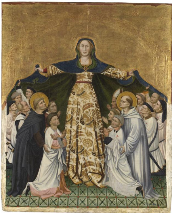
Fig. 5. Nuestra Señora de Gracia y los grandes Maestres de Montesa . Antoni Peris. H. 1412. Museo Nacional del Prado. Madrid

Se le ha querido identificar con alguno de los retratados bajo el manto del retablo de Nuestra Señora de Gracia custodiado en el Prado, ya que el largo periodo de su maestría lo hace compatible con el encargo al pintor Antoni Peris, que se ha venido fechando hacia 1412. 40 (fig. 5) Si que nos consta una referencia a un posible retrato que cita Samper, quien relata que quedó retratado “en la capilla del oratorio del palacio de san Matheo y hazia por armas un escudo partido por medio, a la mano derecha la cruz negra de Montesa en campo de plata y a la izquierda dos cuervos en campo de oro”. 41 Por tanto, tampoco descartamos una posible actuación en las obras de remodelación del palacio maestral de la orden en la población de San Mateo (Castellón), también totalmente perdido, y conocido por planos del siglo XVIII y algunos escasísimos restos de tracería de ventanas, que pueden situarse en una cronología de mediados del siglo XV. 42