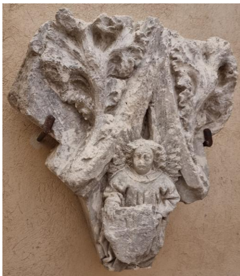
Fig. 4. Remate de arco conopial procedente del castillo-convento de Montesa.

En cuanto a su promotor, el sexto mestre Romeu de Corbera fue uno de los más importantes en el siglo XV, con un largo periodo al frente de la orden, entre 1410 y 1445. Fue muy cercano a los reyes, sirviendo como almirante de la flota aragonesa en la guerra de Cerdeña bajo Martín I y más tarde como embajador del rey Fernando de Antequera en Sicilia, donde alcanzó el título de Virrey. Volvió a dirigir la flota para el rey Alfonso en 1421 y llegó a alcanzar la Lugartenencia del Reino de Valencia en 1429. 37 Durante su mandato se conoce su interés por la actividad arquitectónica y artística, patrocinando varias obras en el castillo de Montesa y en otros lugares relacionados con la orden. De 1431 data la capilla de la Santa Cruz construida en el capítulo del convento-castillo de Montesa con intención funeraria. A esta capilla, se ha adscrito un remate de arco conopial con un angelillo sosteniendo un escudo con la cruz antigua de Montesa 38 (fig. 4) y a ella pertenecía también un retablo del que quedan solo dos tablas recortadas expuestas en el Museo de la Catedral de Valencia con temas de Santa Elena y la Santa Cruz. 39