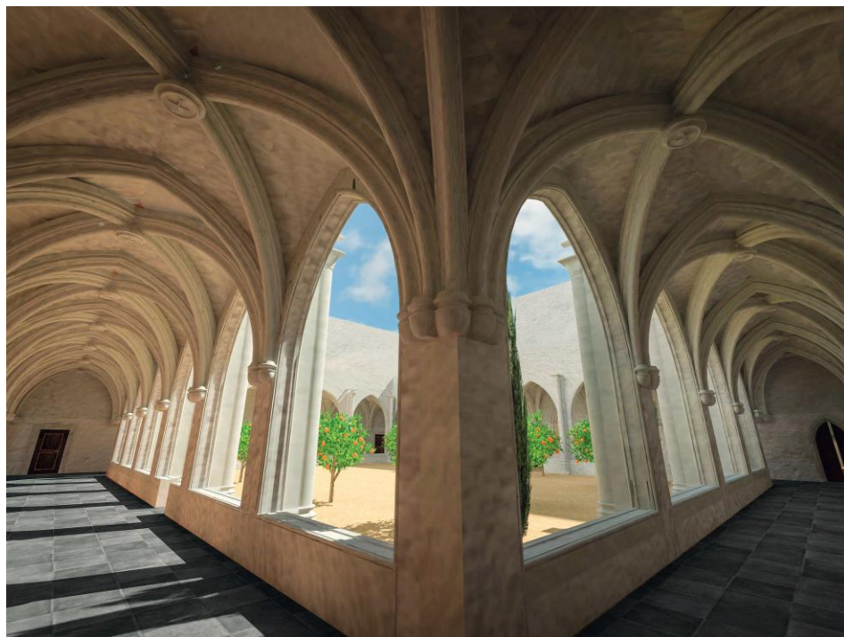
Fig. 2. Propuesta de reconstrucción virtual del claustro de Montesa por Juan Carlos Navarro Fajardo

Las capillas más importantes de este claustro eran la dedicada a Nuestra Señora de Gracia, que albergaba el retablo atribuido a Antoni Peris con la Virgen acogiendo a los freires de la orden bajo su manto, cuya tabla principal se conserva en el Museo del Prado y el resto en el palacio arzobispal de Valencia. Esta capilla también era conocida como capilla de los difuntos, pues era lugar de enterramiento, con su correspondiente osario. Se encontraba en el lado suroeste del claustro, cercana al muro de cierre de la iglesia. Justo enfrente, en el lado este, se ubicaba el aula capítular, donde también se encontraba la capilla de la invocación de la Cruz instituida por Romeu de Corbera en 1431. Junto a esta e inmediata a la puerta por donde se entraba al segundo patio estaba la capilla de San Miguel con un retablo encargado en época de Francesc Bernat Despuig (1503-1537), y delante de esta, otra dedicada a la Presentación en el Templo. 6