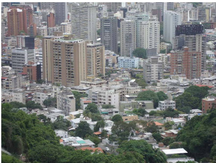
Fig. 5. Fenómeno “ciudad dentro de ciudad”. Sectores Chacaito-Chacao.

El siglo XX se cierra en medio de un panorama en profunda crisis, marcado por la dualidad entre la globalización y la pobreza (Cariola y Lacabana, 2001). En este contexto, el candidato presidencial Coronel Hugo Chávez, figura desligada de los grupos políticos tradicionales se impone con una mayoría absoluta en los comicios electorales del año 1998 (Banko, 2008). En su primer año de gestión (1999), se aprueba una nueva Constitución, fundamentada en el ejercicio de la democracia participativa y protagónica, que marca el inicio de un nuevo proceso de crecimiento y transformación de la ciudad.