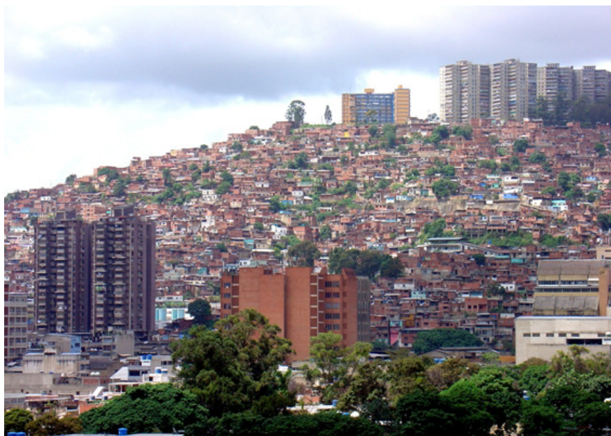
Fig. 4. La otra cara de la modernidad. Barrios en Propatria.

Se evidencia así, el otro lado de la modernidad. Se consolidan los barrios de ranchos en las periferias de la ciudad como parcelaciones ilegales, sin un proyecto conjunto, carentes de infraestructura sanitaria con un aspecto irregular, a pesar de su regularidad interna (Marcano, 1994). Además, surgen las casas de vecindad, que suelen encontrarse en el interior de las manzanas o en los edificios abandonados en el centro de la ciudad, que progresivamente se van deteriorando. A su vez, los planes iniciales del modelo moderno son incumplidos. Las parcelas se dividen porque su precio es muy elevado para un sólo promotor, las viviendas que se construyen tienen más pisos de los previstos inicialmente y los espacios verdes se reducen significativamente para rentabilizar el suelo.