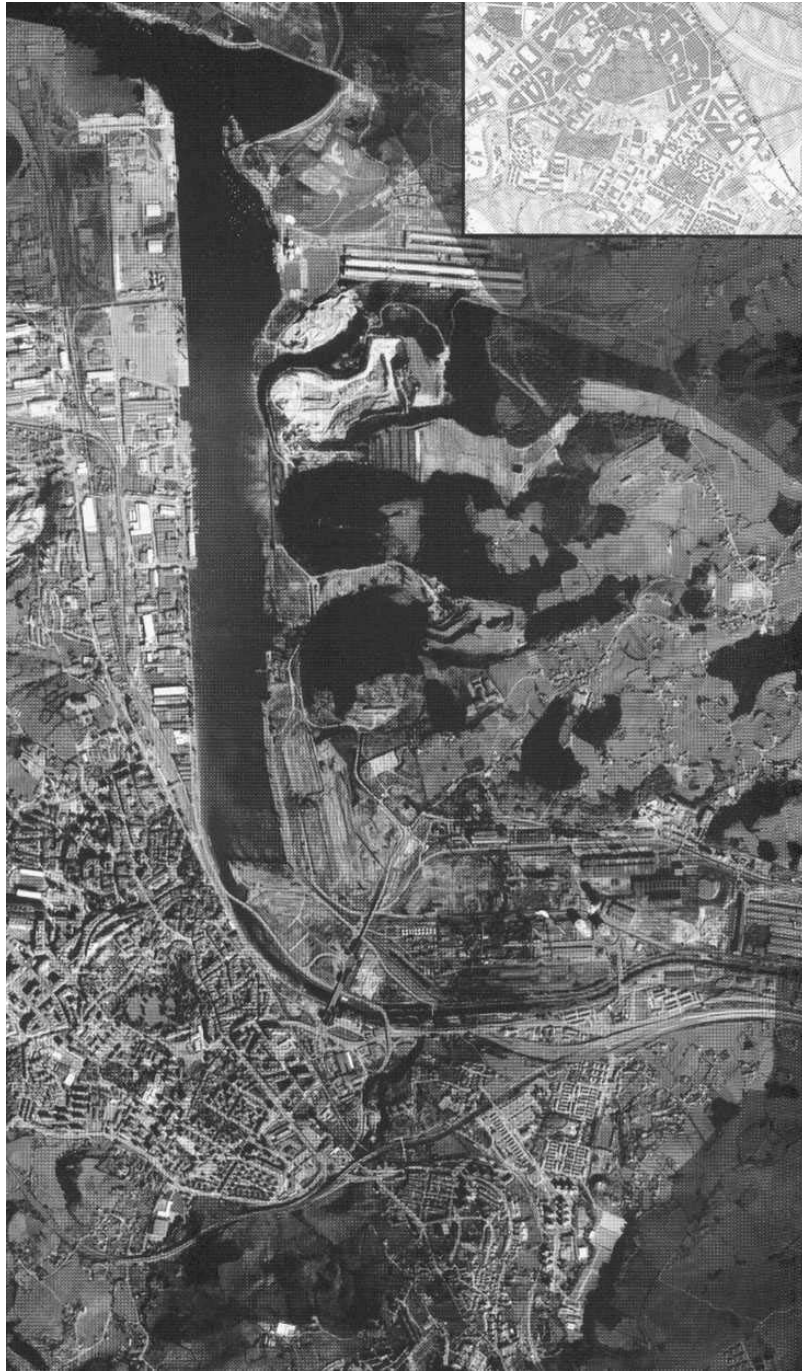
Plan General de Avilés: presente.