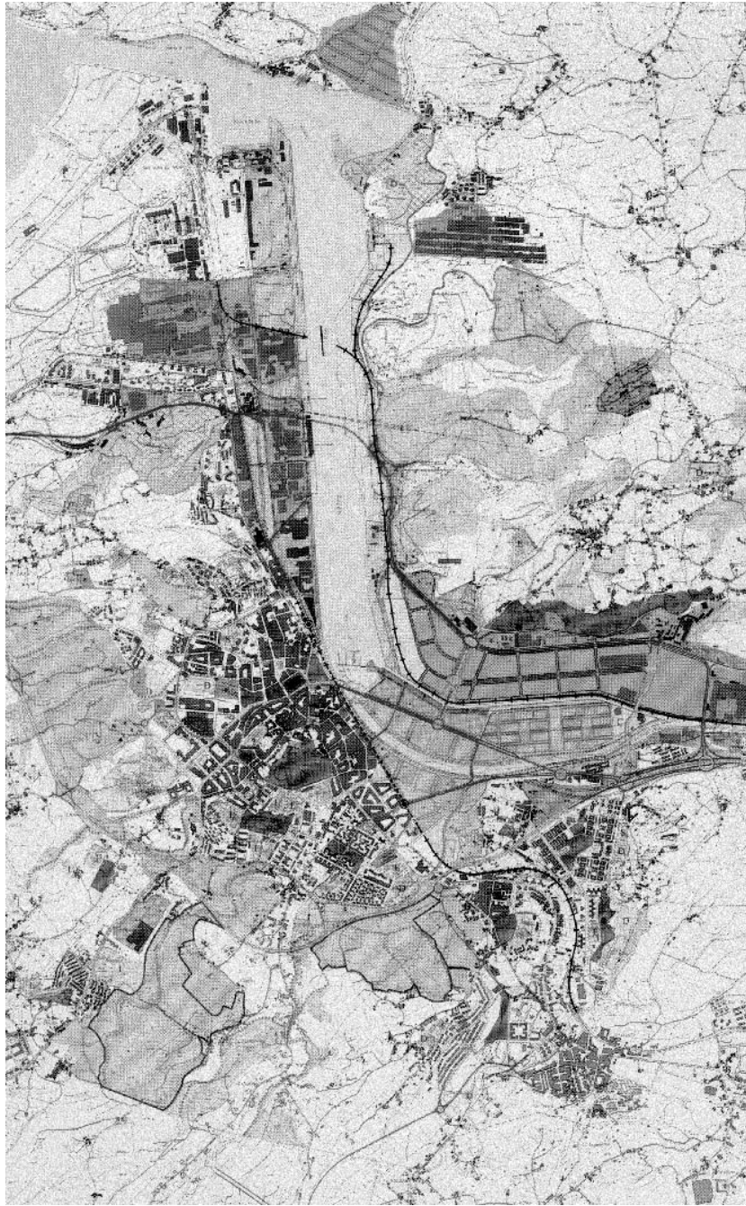
Plan General de Avilés: plano de estructura urbana.