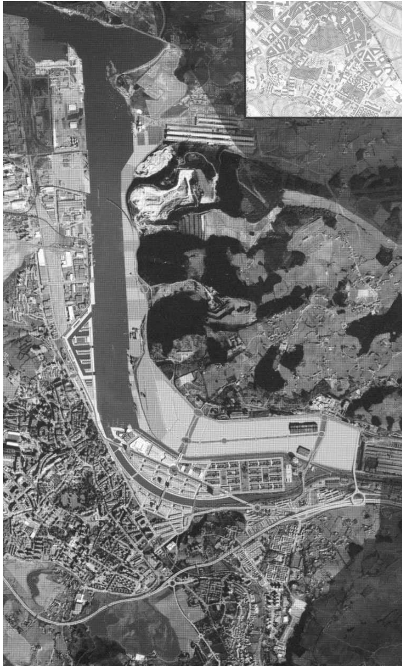
Plan General de Avilés: futuro.