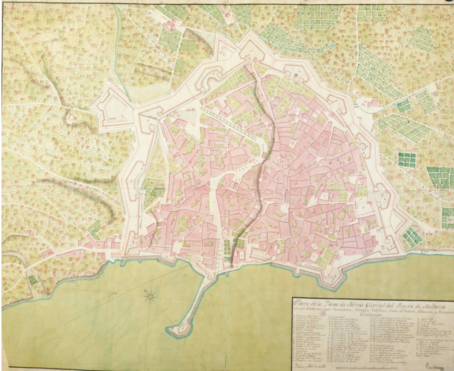
Figura 4: Mapa histórico donde se refleja la dualidad urbana de Canamunt i Canavall en Palma.

nuevos” ya son parte del referente insular. La festividad participativa puede entonces entenderse como una forma de integración o puesta de largo, desde el aprendizaje de la utilidad de la dualidad para el referente insular.