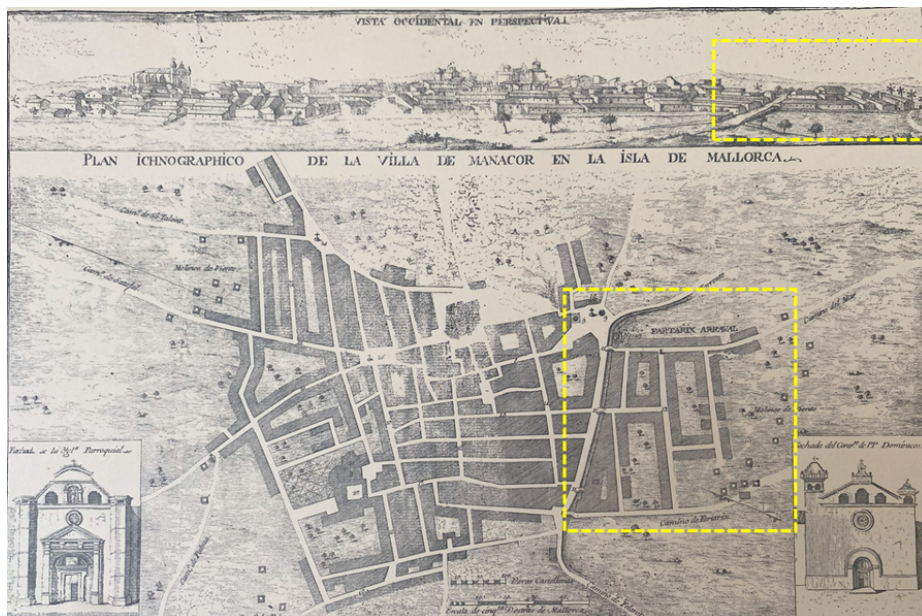
Figura 3: Plano y vista perspectiva de Manacor del siglo XVIII sobre el que se ha remarcado el arrabal de Fartàritx.

Esta festividad se diferencia del caso de Palma, que posteriormente se analizará, en qué no manifiesta la dualidad directamente, sino que se plantea más como una contra-fiesta interna de un sector de Manacor.