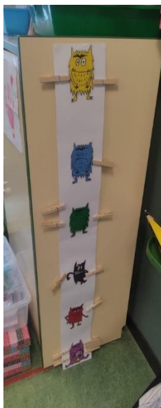
Figura 5. “Emocionómetro”

Seguidamente, se les explicó que cada día debían coger su foto y colocarla en la emoción que sintieran en ese momento. Una vez que la maestra les preguntara ¿cómo te sientes hoy? , entonces debían colocar su foto en la emoción que creyeran adecuada.