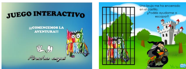
Figura 7. Juego interactivo, ¡comienza la aventura!