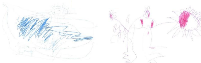
Figura 3. Producciones de los niños sobre hoja en blanco (tristeza y amor)

En cuanto a la representación de las emociones, todos los estudiantes han sido capaces de representar lo que se les pedía y han sabido relacionar la emoción con una experiencia de su propia vida.