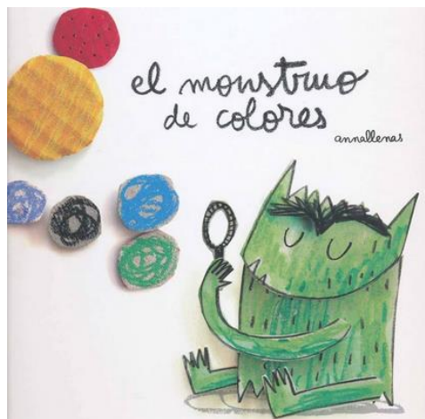
Figura 1. El monstruo de los colores

Schiller y Peterson (1997a, 1997b) sugieren contar un cuento muy corto y previo a las diversas actividades matemáticas. En este caso, para esta propuesta, se encontró el cuento “El monstruo de colores” de Anna Llenas (2012), cuyo protagonista es un monstruo que no comprendía lo que pasaba con sus emociones (ver Figura 1) y, a partir de él, se ha creado una variación de elaboración propia llamada “Las aventuras del monstruo de colores” para poder integrar las emociones junto con las matemáticas (ver Figura 2).