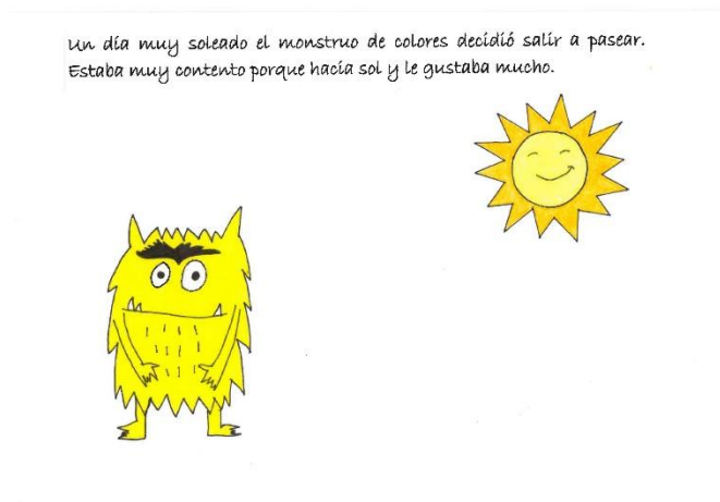
Figura 2. Primera página de las Aventuras del Monstruo de Colores

A continuación, se indica el link donde se muestra el cuento adaptado: https://youtu.be/oZa1DGGAY8Y . Cabe destacar que todas las actividades se realizaron con el cuento físico. No se realizó dramatización del cuento con marionetas, como sugiere Saá (2002).