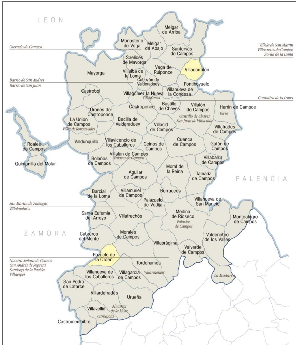
Mapa 2 Señoríos en la Tierra de Campos vallisoletana (1752)

ejemplo de esto que se señala el caso del duque de Osuna, que en ese momento era además conde de Uruña. Aun cuando es una misma persona -Pedro Téllez-Girón y Pérez de Guzmán, VIII duque de Osuna-, aquí aparece como dos titulares diferentes: duque de Osuna y conde de Uruña.