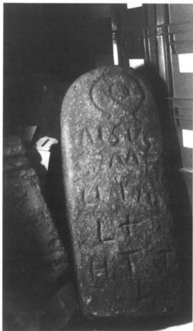
Inscripción nº 1