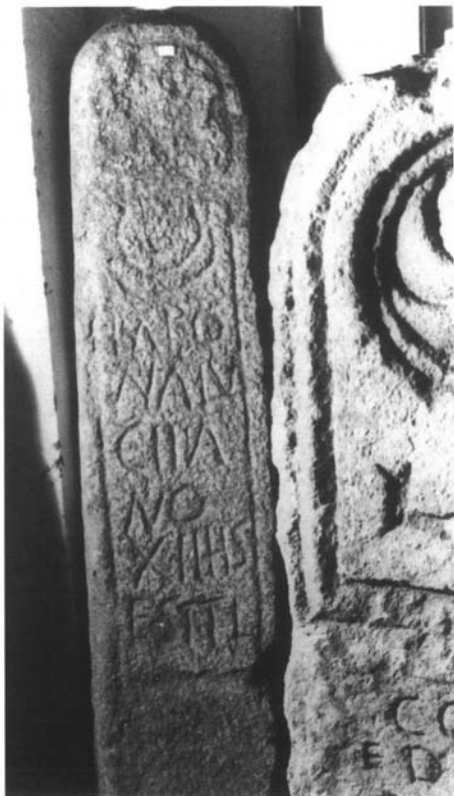
Inscripción nº 4