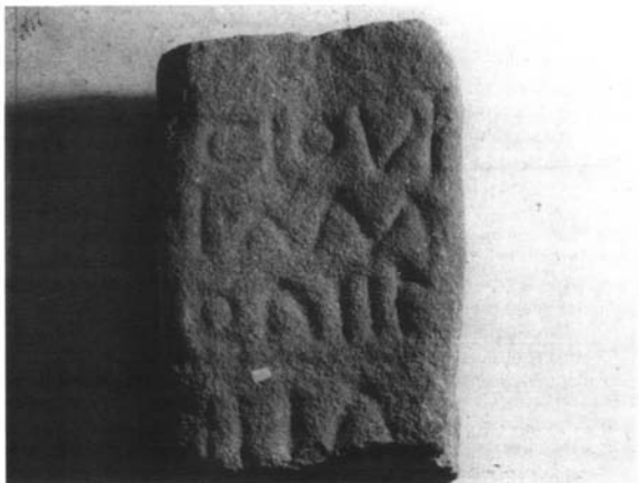
Inscripción n° 8