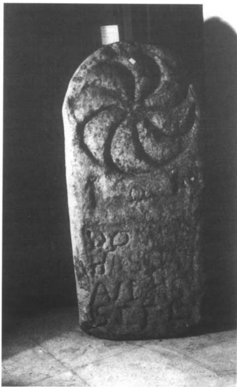
Inscripción nº 5