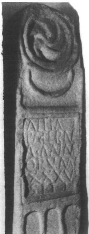
Inscripción n° 7