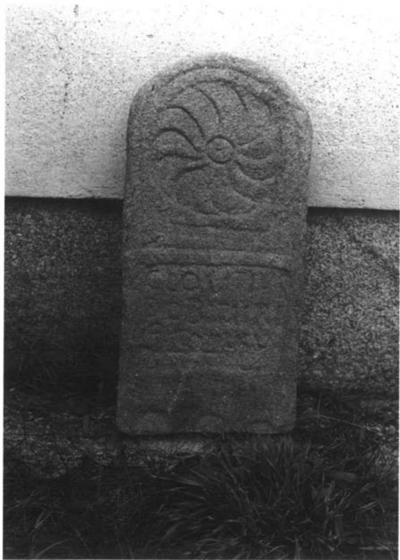
Inscripción nº 9