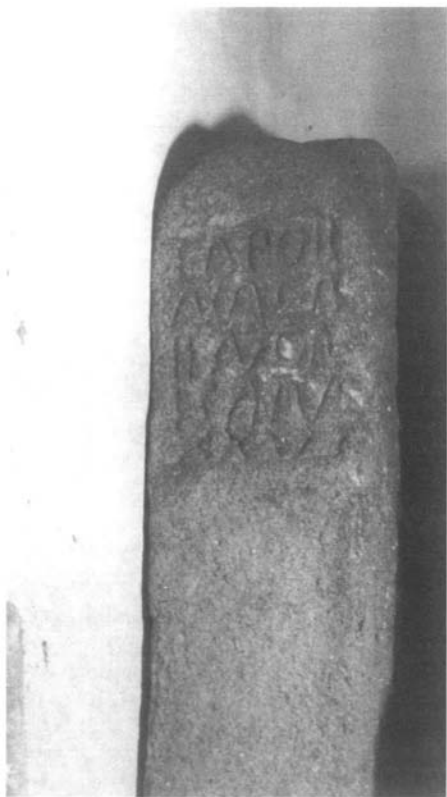
Inscripción nº 3