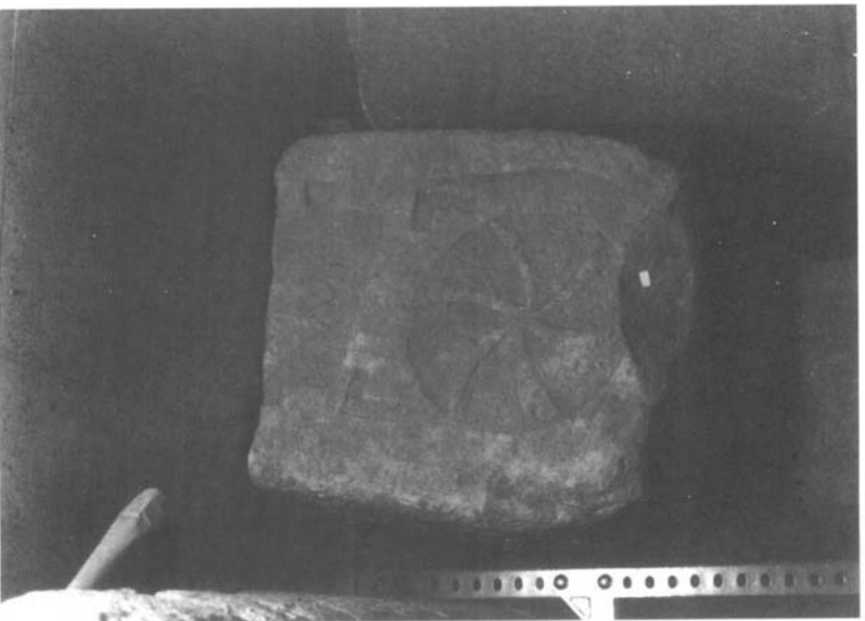
Inscripción n.º 6