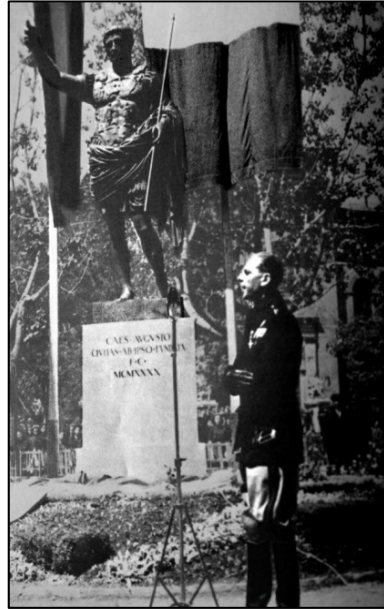
FIGURA 1. Augusto de Prima Porta, regalo de Benito Mussolini a la ciudad de Zaragoza.

De hecho, como ocurre en tantas otras ocasiones, el sentido del influjo se invierte y las reelaboraciones fabricadas en torno a una idea o una personalidad de la Antigüedad provocan una matización, cuando no una deformación, de nuestra percepción de la propia realidad antigua. Este es el caso de la imagen del primer emperador que proporciona Ronald Syme en The Roman Revolution (1939), libro de profunda influencia en su