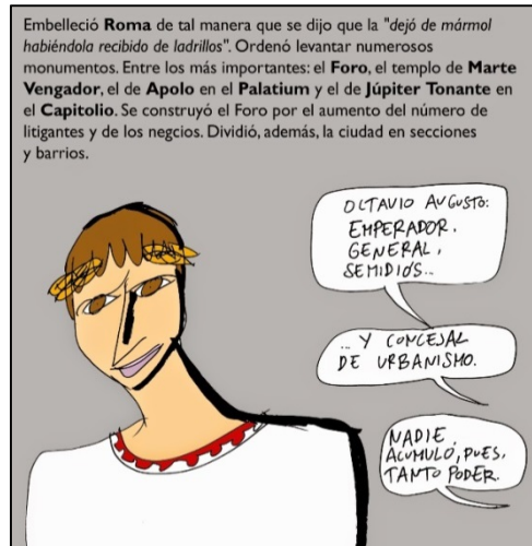
FIGURA 4. "Octavio Augusto (29), de Suetonio", plancha de Rubio.

Por último, la conocida y ya varias veces mencionada imagen de Augusto de Prima Porta, que suele ser datada en un momento posterior a la muerte del emperador (FIGURAS 1, 2 y 3), al igual que su representación como pontifex maximus (Museo Nazionale Romano, Roma), realizada hacia el año 20 a.C., cuando el emperador tendría en torno a setenta años, representan una imagen idealizada del dirigente, en la que se ha eliminado cualquier rasgo que avejentara su aspecto y se han potenciado, en cambio, los elementos que lo identifican como un hombre joven, fuerte y saludable. Esta imagen, que se quiso canonizar, en detrimento del realismo, como proyección de su perfección para la posteridad, ha sido interpretada como un rasgo de vanidad masculina e incluso como un precedente del concepto moderno de 'metrosexualidad' 34 .