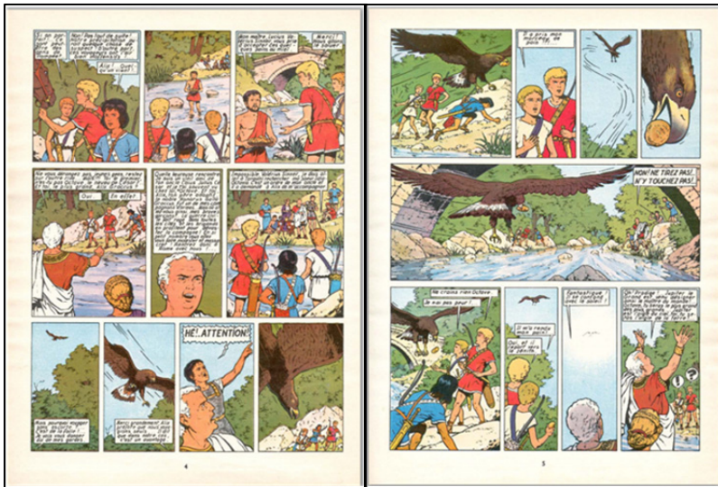
FIGURA 5. Alix 8. Le Tombeau étrusque , 1968, 4-5. (© Martin / Casterman.)

Oh! Prodigel... Jupiter le Grand est venu désigner ainsi le maître du monde!... Octave, tu seras le plus grand des plus grands... Jupiter est l'aigle du ciel, toi, tu seras l'aigle de la terre!... ( Le Tombeau étrusque , 5).