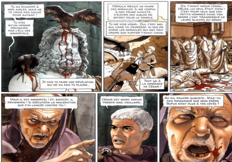
FIGURA 6. Alix Senator 1. Les Aigles de sang , 2012, 48. (© Martin / Mangin / Démarez / Casterman.)

Allons, Alix! Reprends-toi! Tu es un sénateur! Si tes fils sont morts, tu en adopteras d'autres, comme moi! (ibid. 46).