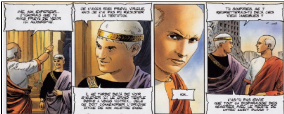
FIGURA 9. Le Dernier Troyen 6. Rome, 2008, 3. (© Mangin / Démarez / MC Productions.)

dio origen al Orbis. Con este marco narrativo, cada episodio de El último troyano 57 presenta una etapa del viaje de un Eneas espacial, fundador mítico de ese reino, que sale del planeta Troya en busca de la tierra prometida por los dioses. Las seis entregas están demarcadas por un prefacio y un epílogo protagonizados por el propio Virgilio en su recitación de su obra. Con esta manipulación, semejante a la de sus homólogos en el mundo antiguo, el nuevo Augusto pretende hacer de ese mítico y glorioso pasado un modelo y una justificación de la grandeza del Imperio galáctico; esto es algo que se observa claramente en la galería de antigüedades que Augusto posee, con reliquias de las aventuras de este Eneas espacial. Todas esas historias y vestigios remiten de manera secundaria a la verdadera Roma antigua, de la que los protagonistas tienen plena conciencia (tanto en el presente de Virgilio como en el pasado mítico, protagonizado por Eneas, que narra el primero) y que actúa como molde para la configuración del Orbis.