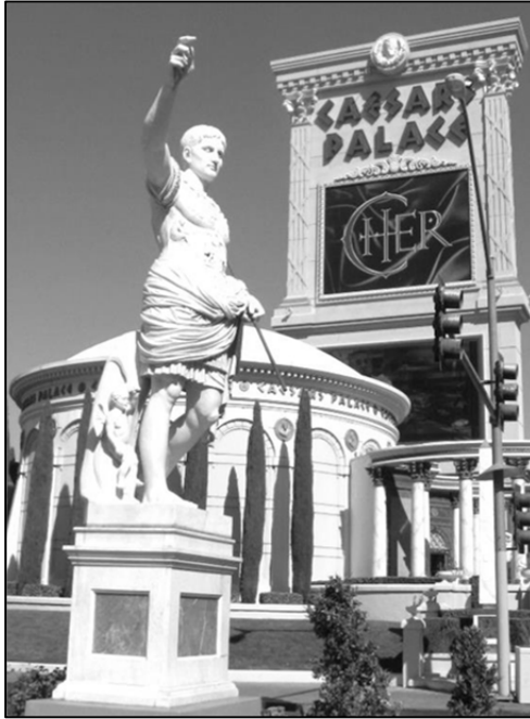
FIGURA 2. Augusto de Prima Porta ante el Caesar's Palace.

en la que pueda reconocerse aunque solo sea una sombra del mundo clásico, está dando unos frutos muy sugestivos en los últimos años.