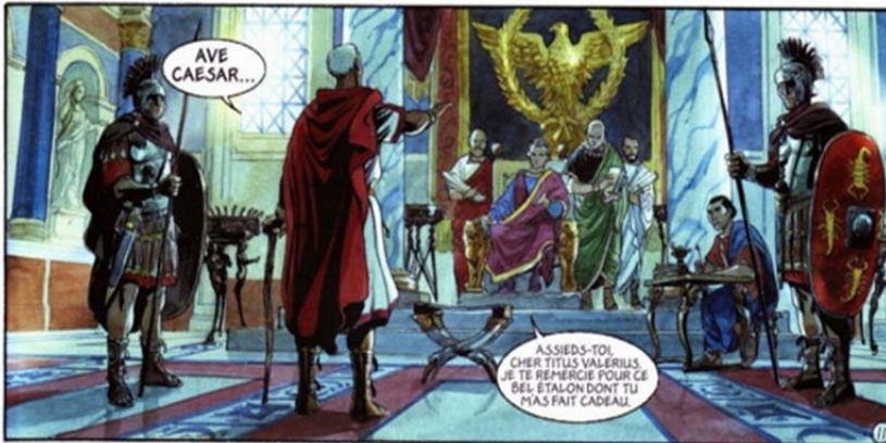
FIGURA 7. Les Aigles de Rome 1, 2007, 11. (© Marini / Dargaud.)

Por su parte, Las águilas de Roma ( Les Aigles de Rome ), de Enrico Marini 46 , narra la amistad de dos soldados romanos en época de Augusto 47 . Tras haber sometido Druso a los bárbaros de Germania, el príncipe Sigmar entrega a los romanos a su