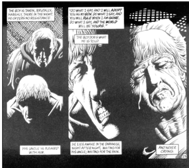
FIGURA 8. The Sandman 30. August, 1999, 23.

los lectores, sí tomamos conciencia de ese secreto, que no es otro que la violación a la que le sometió su tío Julio César, cuando él tenía tan solo dieciséis años (FIGURA 8). La idea la encontramos ya en las fuentes antiguas. Suetonio 53 refiere que Marco Antonio lo acusó de haber comprado la sucesión de su tío con el pre-