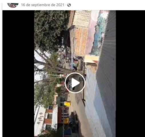
Ejemplo de publicación con video.