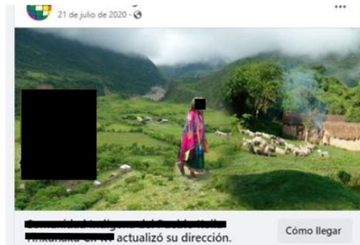
Publicación con actualización de dirección (ubicación).