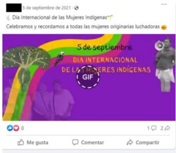
Publicación con uso de GIF.