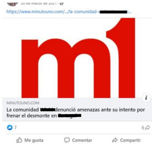
Publicación en la que se comparte el link de una página web de noticias.