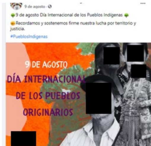
Publicación propia con texto e imagen.

(muchos de ellos, compartidos desde otras páginas o perfiles de Facebook ), como se muestra a continuación: