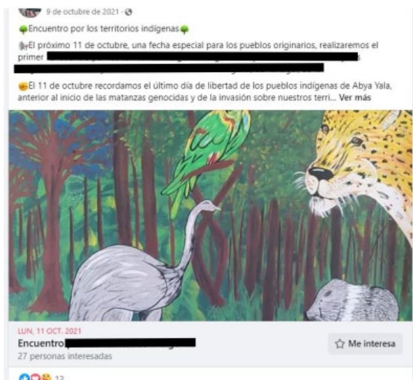
Publicación con recurso evento.