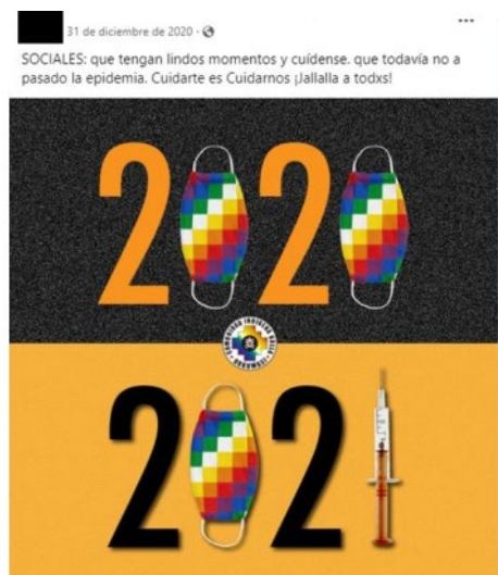
Publicación con imagen reforzando el contenido de la publicación escrita.

Esta frecuencia de uso cobra sentido cuando se piensa los discursos digitales desde su dimensión multimodal. De esta forma, siguiendo a Bou-Franch y Garcés-Conejos Blitvich (2019, p. 5, p. 9), ello no solo implica que la utilización de imágenes, videos, audios y demás aporta significado a lo que se publica, sino que, muchas veces, son esos recursos no verbales los que complementan e intensifican la fuerza con la que se comunica el mensaje: