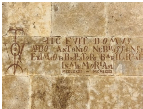
Figura 9. Vítor homenaje a Elio Antonio de Nebrija

El segundo vítor rememora a Hernando de Talavera (ca. 1430–1507), quien también cursó estudios en la Universidad de Salamanca, formándose en Artes y Teología antes de ingresar en la Orden de San Jerónimo. Reconocido como humanista y religioso, fue confesor de Isabel la Católica y primer arzobispo de Granada: Hernando de Talavera olim alumnvs magister VTAS concives commemorant XXVI APR. MCMLXXXV (“Hernando de Talavera, antiguo alumno y maestro de la Universidad, sus conciudadanos lo conmemoran. 26 de abril de 1985”).