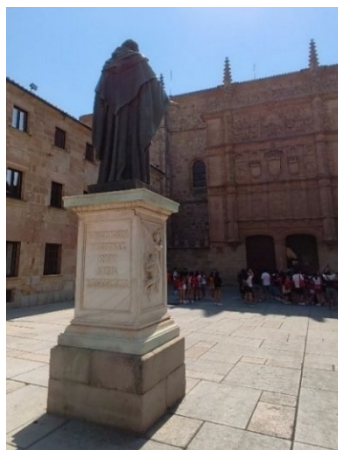
Figuras 5 y 6. Monumento a fray Luis de León