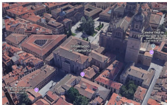
Figura 1. Entorno del edificio histórico de la USAL.

Dada la naturaleza específica de este trabajo, se parte de la premisa de que el alumnado realiza una estancia académica en Salamanca, ciudad reconocida internacionalmente por su relevancia en la enseñanza de ELE, o para alumnado de la propia universidad. Como punto de partida, el docente guiará un recorrido por los alrededores del edificio histórico de la Universidad de Salamanca, con el fin de observar las placas e inscripciones conmemorativas y otros elementos culturales presentes en el espacio. El itinerario incluirá las calles Benedicto XVI, Calderón de la Barca, una parte de Librereros y el Patio de Escuelas Mayores. Cada estudiante deberá disponer de un cuaderno de notas o un blog personal donde, a modo de diario, registre las ideas y reflexiones que el docente vaya indicando durante la visita a cada placa.