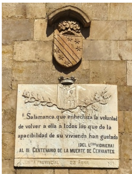
Figura 8. Placa homenaje al III centenario de la muerte de Cervantes

La frase expresa el atractivo perdurable de la ciudad y su capacidad para despertar vínculos emocionales en quienes la visitan o habitan, poniendo de relieve el carácter acogedor y el valor simbólico del entorno urbano salmantino.