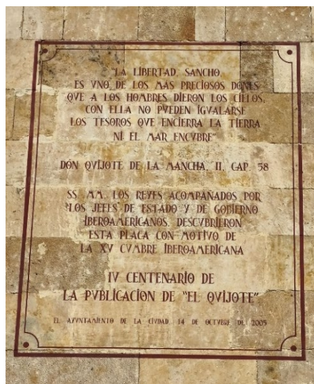
Figura 7. Inscripción homenaje al IV centenario de El Quijote

“La libertad, Sancho, es uno de los más preciados dones que a los hombres dieron los cielos. Con ella no pueden igualarse los tesoros que encierra la tierra ni el mar encubre” Don Quijote de la Mancha, II, cap. 58 SS. MM. los Reyes, acompañados por los jefes de Estado y de gobierno Iberoamericanos, descubrieron esta placa con motivo de la XV Cumbre Iberoamericana IV centenario de la publicación de “El Quijote” El Ayuntamiento de la ciudad 14 de octubre de 2005.