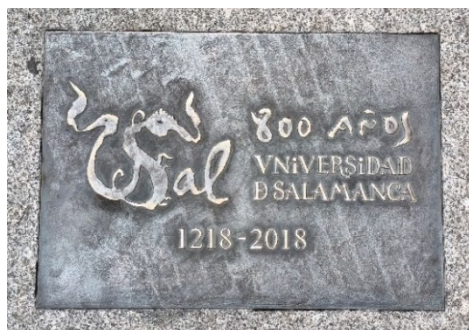
Figura 4. Logo para la efeméride del VIII centenario

imagen que combina tradición e historia, utilizando una iconografía que, al igual que la Universidad, ha evolucionado con el tiempo.