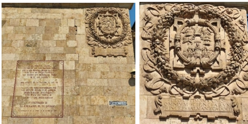
Figuras 2 y 3. Lema en latín de la Universidad de Salamanca

En el primer eje temático, sobresalen dos elementos vinculados a la historia y al papel institucional de la Universidad. El primero es la inscripción en latín: Deo optimo maximo omnivm scientiarvm princeps Salmantica docet (“A Dios, el Mejor y más Grande; Salamanca, primera en todas las ciencias, enseña”), lema que sintetiza la tradición académica de la institución y refuerza su prestigio y carácter pionero en la enseñanza de diversas disciplinas científicas y humanísticas.